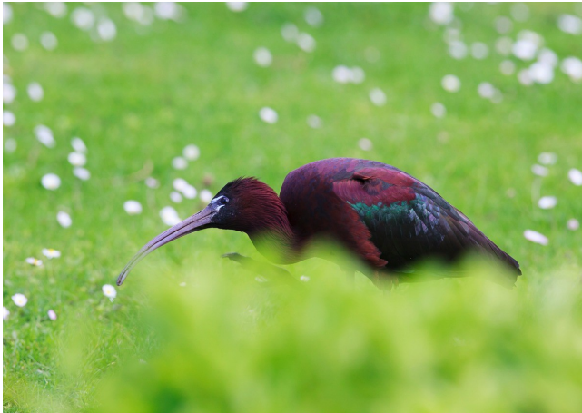
Xixón 29/04/2012

Otra zona en la que invernaron fue Xixón, con citas por los parques y prados de las afueras, y del dormidero del Parque de Isabel la católica. La primera cita fue el 03/02/2012 con tres aves vistas en el Parque de Isabel la católica (LAAU). Los números en el dormidero fueron aumentando paulatinamente, hitos de interés: nueve el 20/02/2012 (LAR & YMA), 29 aves el 15/03/2012 (TLL), 31 individuos el 14/04/2012 (JVS) el máximo de la temporada. Además hay numerosos registros de aves en el Parque de la Aliseda Pantanosa (AVM, JVS, LAAU, LAR, RHA, TLL, PFP & YMA), con un censo máximo de 35 aves en vuelo el 09/04/2012 (JBP).