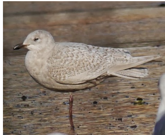
Bañugues 08/02/2014

observaciones repartidas por la costa central, que seguramente corresponden al mismo ejemplar, un ave de primer invierno de la subespecie nominal. El primer registro se produce en la Playa de Xivares (Carreño) el 18/01/2014 (JAGC), anotándose después en la Ensenada de Llobero, Ría de Avilés (Avilés/Gozón) el 26/01/2014 (COAN, JVR, MQB & RFR). Posteriormente se mantuvo estacionado entre la Ría de Avilés y la Playa de Salinas (Castrillón) hasta abril (citas para esta temporada de: A&GH, DDD, DLV, EGS, ICG, JAGC, JVS, MQB, PFP, RMF & XCP), aunque se produjeron registros aislados en la localidades de El Musel (Xixón) el 01/02/2014 (XCP), Bañugues (Gozón) el 08/02/2014 (JAGC), y Cabu Peñes (Gozón) el 08/03/2014 (XCP).