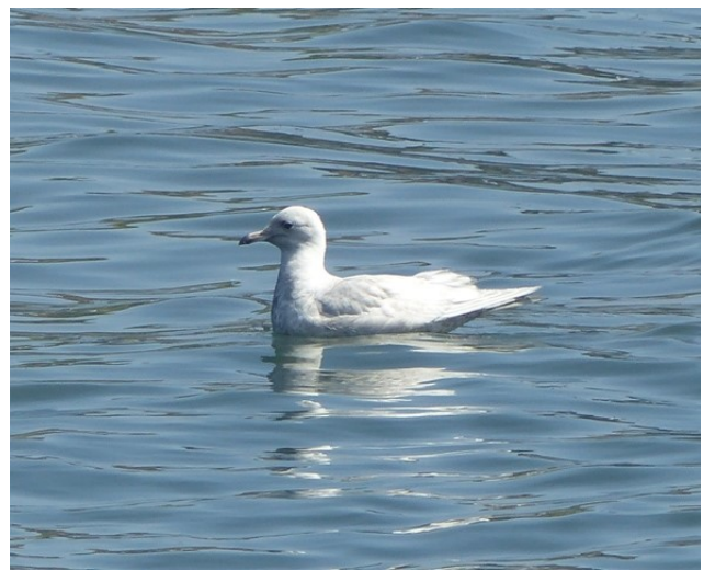
Avilés 14/04/2018

Además, se registró en el Puerto de Avilés un ave de primer invierno los días 13/04/2018 (DLV), y 14/04/2018 (JAGC), ave anillada el invierno anterior en el sur peninsular.