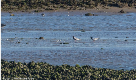
Lloderu 14/05/2019