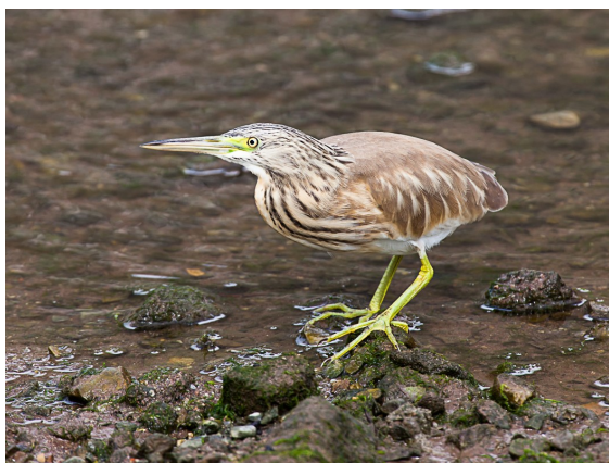
Xixón, 01/09/2011

Se localizó un ave en el Parque de Isabel la católica el 20/08/2011 (PFP), que permanecería entre este parque urbano y los alrededores del Río Piles hasta al menos el 18/09/2011 (ABF, BBC, DAF, GGM, JAGF, LAR, PFP, RMM & YMA).