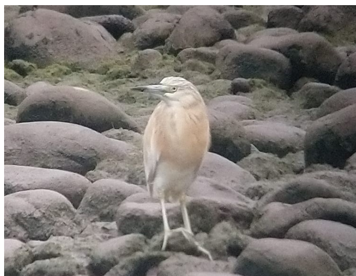
Udrión, 02/07/2020

En el Ríu Nalón, a la altura de Udrión (Uviéu) se observó un ejemplar adulto los días 02/07/2020 y 03/07/2019 (MAFP & JDBR).