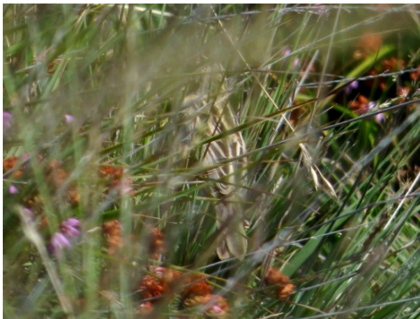
Cabu Peñes 15/08/2018

En la Ría de La Villa (La Villa) el 07/08/2016 se anilló un ave ( www.torquilla.org ), que se recapturó el 14/08/2016 junto con otra ave ( www.torquilla.org ), y el 28/08/2016 se capturaron dos aves en el mismo lugar (desconocemos si eran las mismas).